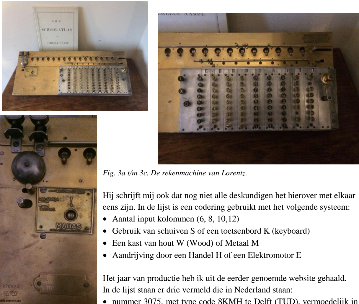
Fig. 3a t/m 3c. De rekenmachine van Lorentz.

Waarom het aantal van circa 17000 meer is dan het eerder genoemde aantal van 5099 hierboven, is me niet duidelijk.