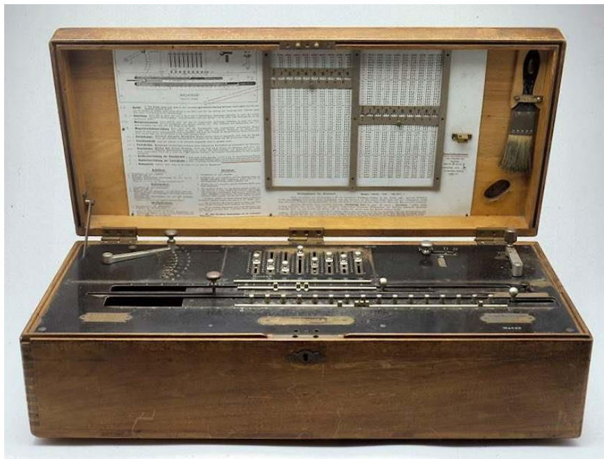
Fig. 6. Millionaire 4089.

Millionaire nummer 6924, met voorlopige type-code 9KMH te Leiden (Teylers Museum), vermoedelijk in 1931 geproduceerd, ontbreekt nog. Zie figuur 7.