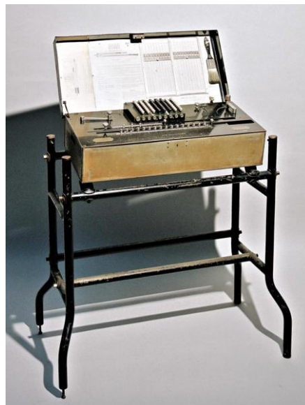
Fig. 4. Millionaire 3075.