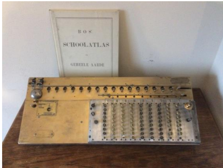
Fig. 7. Millionaire 6924.