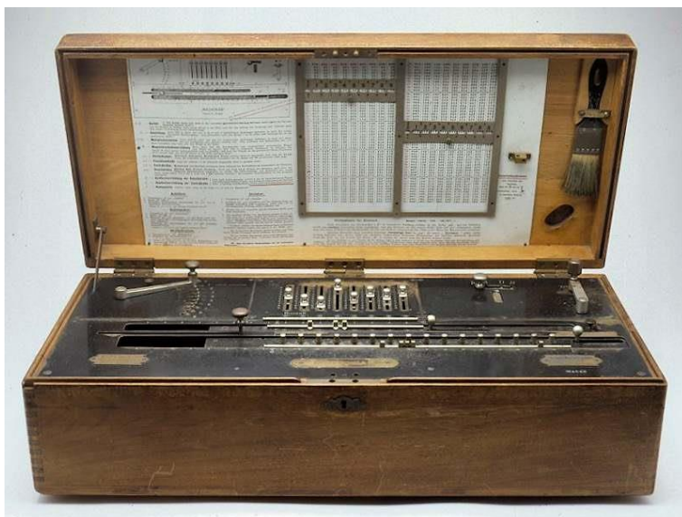
Fig. 8. Foto uit het boekje Verhalen rond een foto.