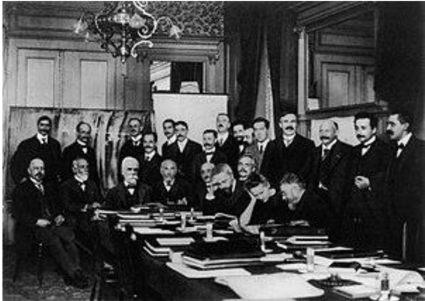
Fig. 2. Bekende foto van de eerste Solvay-conferentie in 1911. Lorentz zittend, vierde van links.