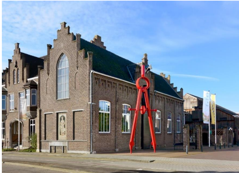
Fig. 6. 'Passer' van Maurice Mentjens, Roermond

De op zich zelf balancerende constructie van staal van Tjoe Fang King stelt een passer voor waarmee een cirkel op het plein is getekend. Als de driehoek naar links of rechts beweegt, maakt het horizontale segment een op en neer gaande beweging. Het kunstwerk bevindt zich op het plein voor het Sociaal Medisch Centrum en Kinderdagverblijf De Speeltuin , in de Lizzy Ansinghstraat, Amsterdam.