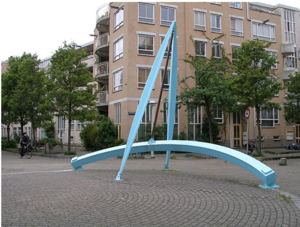
Fig.5. 'Passer', door Tjoe Fang King, constructie Smolenaers BV, 1984

In de openbare ruimte van Nederland zijn meer dan levensgrote passers te vinden, kunstwerken die de omgeving opluisteren. Zie figuur 5.