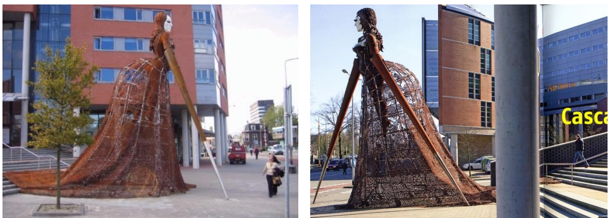
Fig. 7. 'Ultra', Groningen

Een heel andere sfeer ademt ULTRA , door kunstenaar Sylvia B, 2004, in figuur 7.