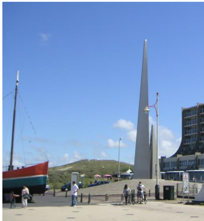
Fig.9. Noorderind, Schevingen