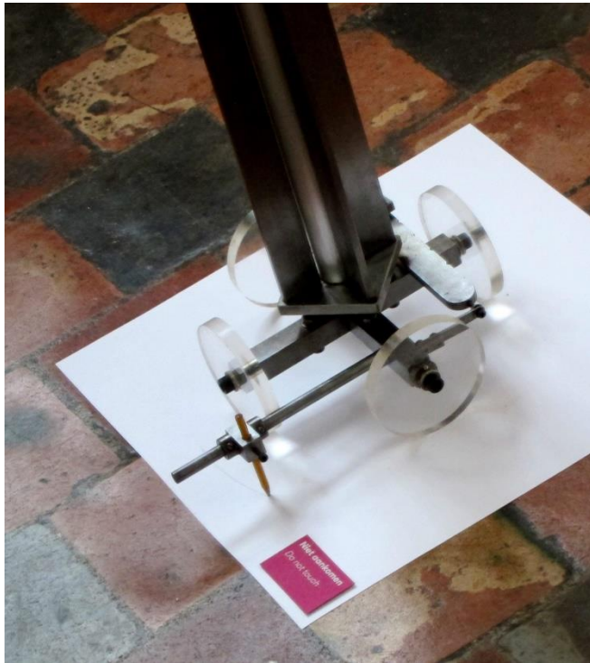
Fig. 10. 'Verticale Cirkelmachine' Gerrit van Bakel (1980)

Weer iets heel anders vonden we in het Prinsenhof in Delft. Een tijdelijke tentoonstelling (2016) toonde een hightech passer uit roestvrij staal, werkend op duurzame energie, die langzaam (in drie maanden) een cirkel beschrijft op een vel papier. Zie figuur 10.