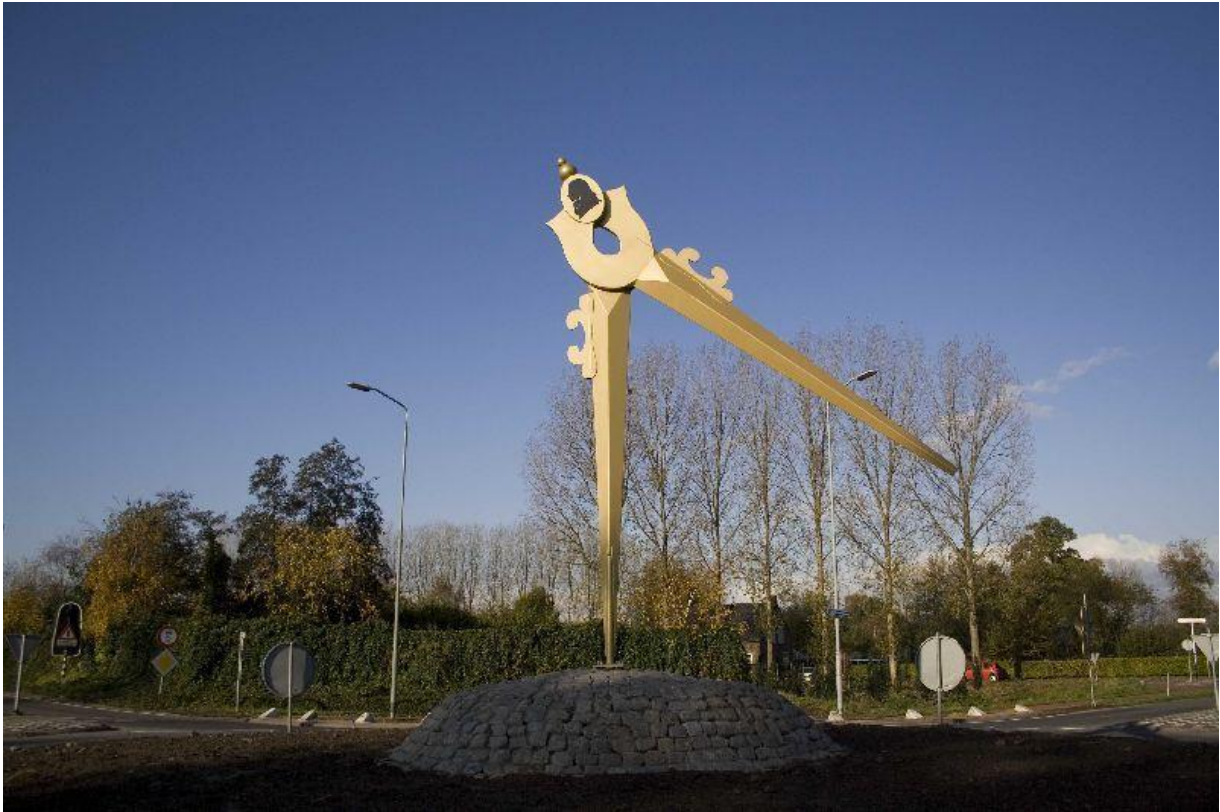
Fig. 8. Passer op rotonde in Boxtel

Figuur 8 toont de passer op rotonde de Geer in Boxtel, kunstwerk nr. 17 van Smolenaers BV, Nederweert (2017).