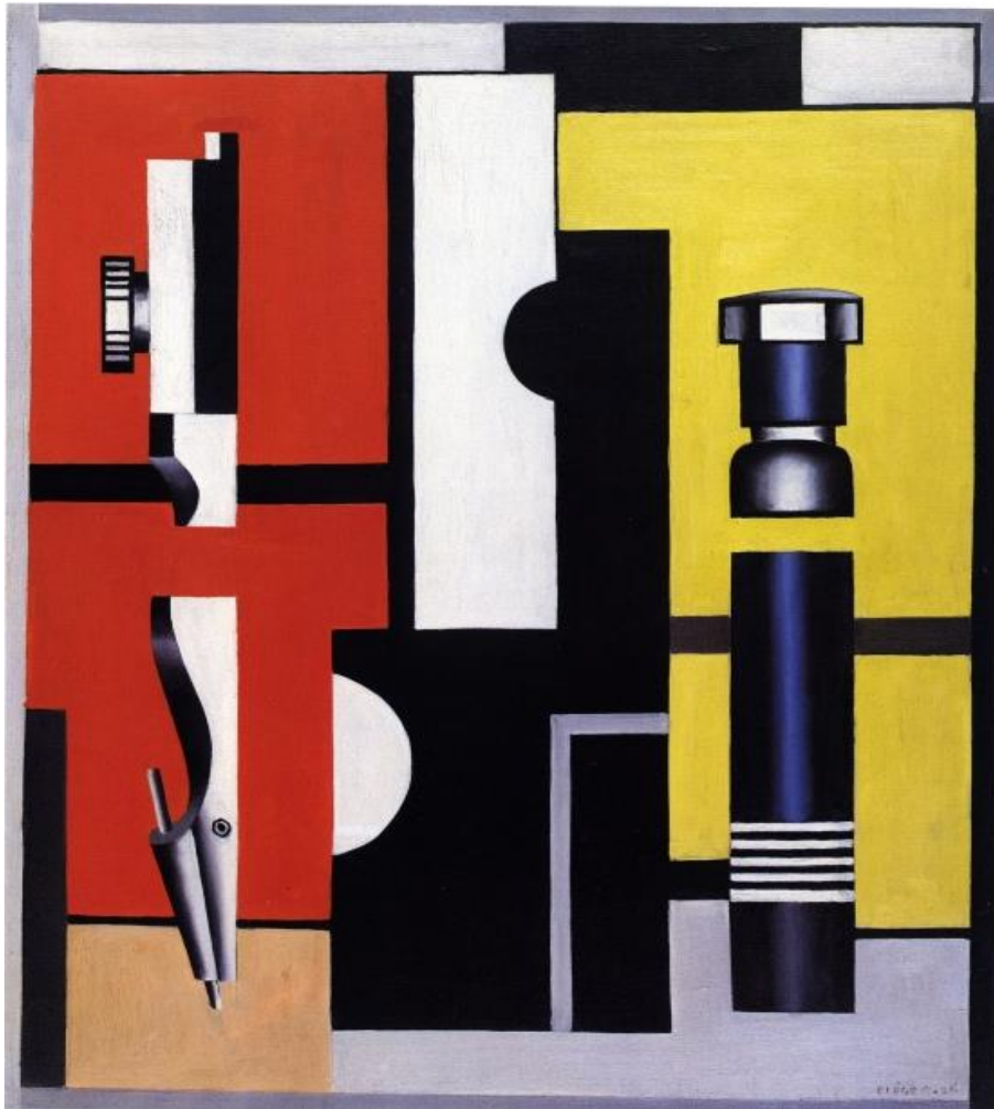
Fig. 2. : Still Life with a Compass, door Léger, 1926