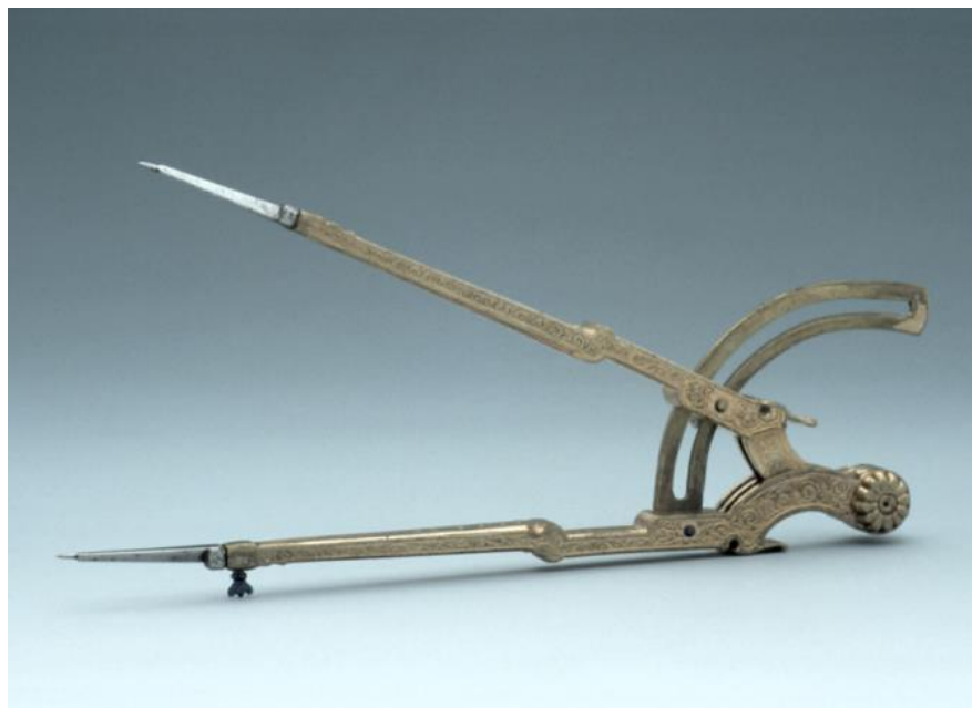
Fig. 3. Passer, vervaardigd door Christoph Trechsler in Dresden, 1604 Museum of the History of Science in Oxford