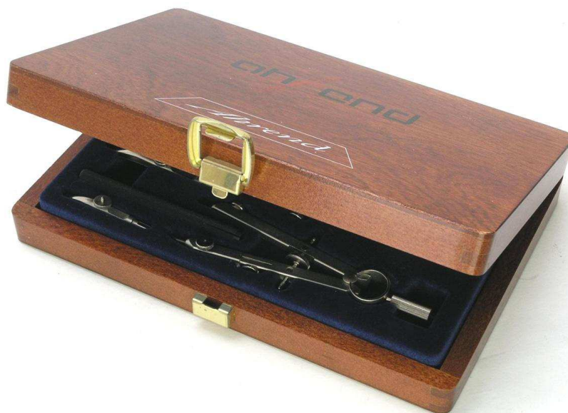
Figuur 6. Ahrend jubileum passerdoos