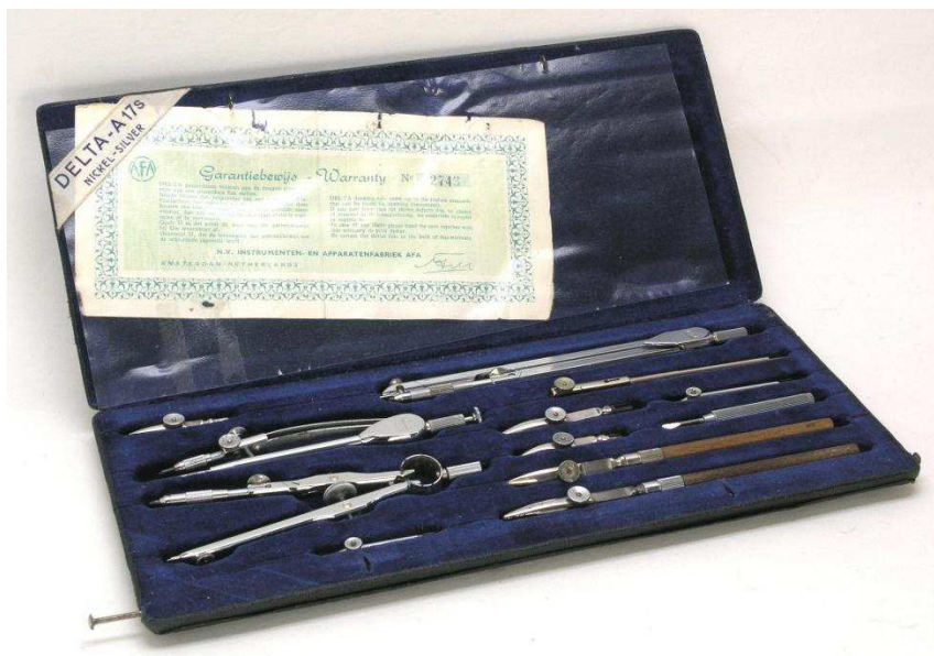
Figuur 5. AFA systeem DELTA

Het ontwerp werd herzien, de fabricagemethoden werden verbeterd en men begon onder de merknaam DELTA deze verbeterde passerdozen te leveren - eerst in nieuwzilver en naderhand in een verchromde uitvoering. Deze passerdozen hadden een klassieke uitstraling en waren van een goede kwaliteit en afwerking (zie fig. 5).