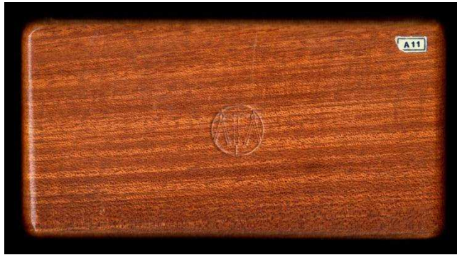
Figuur 3b. AFA passerdoos - gesloten

In een voordracht van Harrie van Dooren, in december 2009 gehouden voor de passerdozenclub, vertelde hij dat AFA in 1948 aan het "Centraal Instituut voor Industrieontwikkeling" een passerdoos (zie fig.4a/b) toonde met een hulpstukje dat op de benen van steek- en inzetpasser gezet kan worden, waardoor de instelnauwkeurigheid van deze passers nagenoeg gelijk wordt aan die van een veerpasser. Nog een bijzonderheid van deze passerdoos was dat de doos vervaardigd werd uit Bakeliet en voorzien was van een invallend transparant deksel, dat werd gesloten met twee verschuifbare pennen.