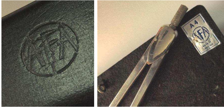
Figuur 2a/b. AFA logo en rechtgeleiding

Tijdens de bezetting heeft hij drie jaar ondergedoken gezeten en volgens zijn oudste dochter geen daglicht gezien. Hij was de enige van zijn familie die de jodenvervolging overleefde, de overigen waren via de Hollandsche Schouwburg afgevoerd naar een vernietigingskamp en vervolgens vermoord.