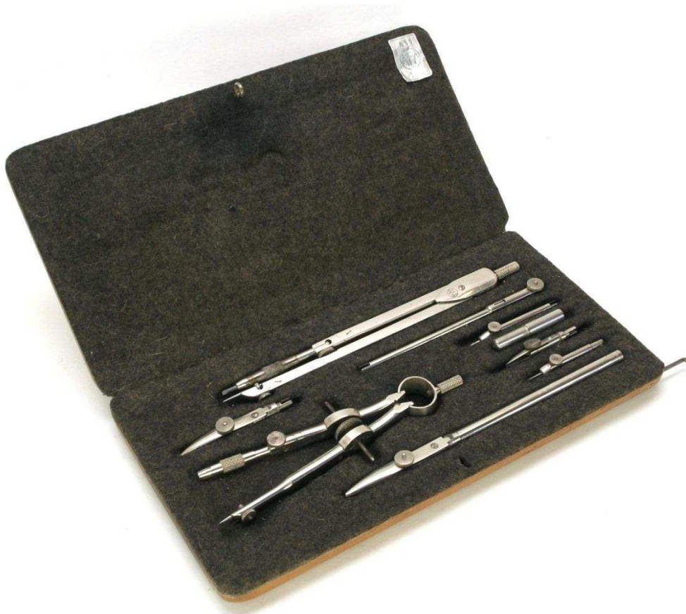
Figuur 3a. AFA passerdoos - inhoud

De passers waren voorzien van een tandwiel rechtgeleiding met rechte tanden, aanvankelijk niet voorzien van het AFA logo. In het bijzonder aan de trekpenen is te zien, dat de fabricage van de onderdelen nogal veel handwerk vroeg.