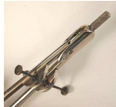
Figuur 4a/b. AFA passerdoos met opzetstukje voor fijninstelling

De passerdozen van het merk AFA voldeden echter niet aan de verwachtingen die men van een product van Stam meende te mogen hebben.