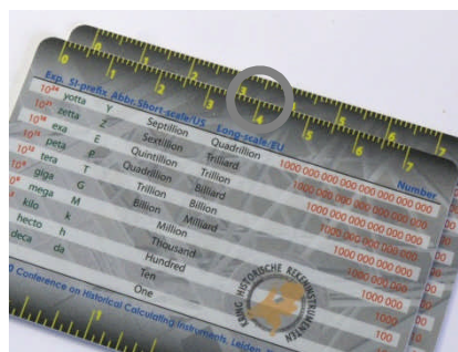
Meting (a) van de breedte van de onderliggende N-card, van de linkerzijde tot de middelschaalwaarde 3,5: 4,0 cm.