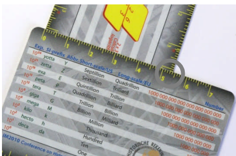
Meting van de hoogte van de onderliggende N-card: 5,4 cm.

De volgende plaatjes tonen de stappen van de workshop opdracht: