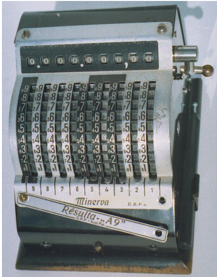
Foto 10 - Minerva / Resulta, telwielmachine